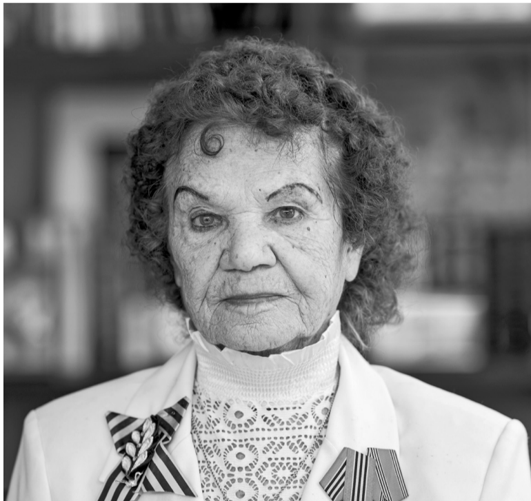
Текст: Александр ЛИТВИНОВ, Автор проекта: Дмитрий ЖИДКОВ

Арт-проект «Воркута. Я здесь седел» посвящен воркутинцам и воркутянам, отдавшим этому городу многие годы жизни, которые в прямом смысле здесь становились седыми. Люди – герои проекта – широкой публике не известны, но их мысли, слова и опыт уникальны.